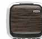
Bel voor andere kleur opties met customer service