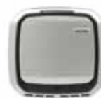
Wit Item #: 9434201