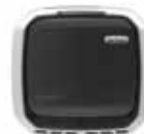
Antraciet Item #: 9434401