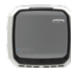
RVS Item #: 9433401